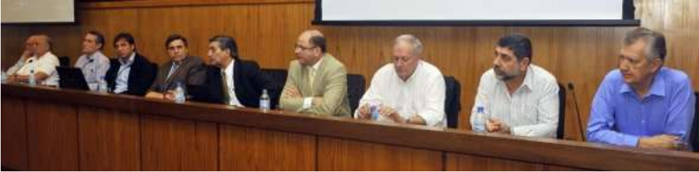
Directivos de Azpa estuvieron acompañados de las cúpulas de la UIP, la ARP y la Cámara de Comercio.

Directivos de Azucarera Paraguaya (Azpa) denunciaron ayer la sospechosa inacción de las instituciones del Poder Ejecutivo, que –presumiblemente– fueron “utilizadas” por los supuestos productores de caña dulce, que bloquearon toda vía de entrada y salida al ingenio azucarero.