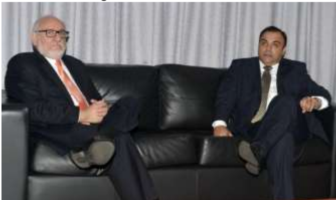
El embajador colombiano Édgar Augusto Cely Núñez junto al fiscal general del Estado. Fue ayer a la mañana en la sede central del Ministerio Público.

Embajador insta a evitar lo que se vivió en Colombia -- El embajador de Colombia, Édgar Augusto Cely Núñez, advirtió ayer que no se debe permitir que Paraguay llegue a lo que vive Colombia con la guerrilla.