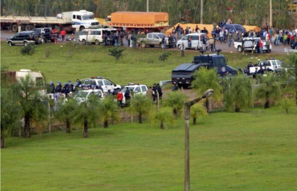
Los denunciantes facilitaron ayer esta foto a la prensa, en la que (aseguran) la propia Policía impedía la libre circulación de los camiones de la industria azucarera.